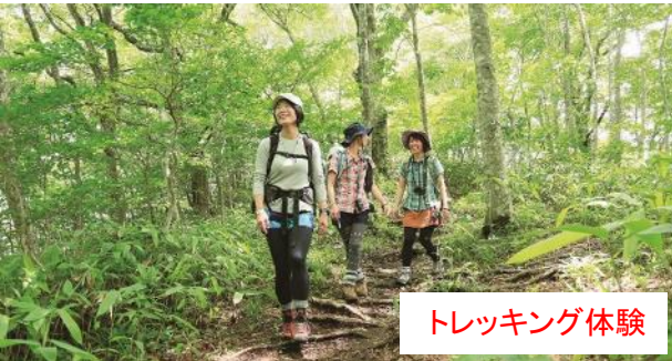
トレッキング体験

中国山地のほぼ真ん中に位置する庄原市は、豊かな森と清らかな川といった美しい自然の宝庫です。清流を下るラフティングや美しい山の中を歩くトレッキングなど、さまざまな体験プログラムが楽しめます。どのプログラムもチームワークや主体性の育成などの教育的な効果が期待できます。