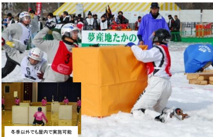
冬季以外でも屋内で実施可能

庄原市は全国でも有数の強豪地区であり、2016年の全国大会では小学生の部・レディースの部・一般の3部門で優勝しています。