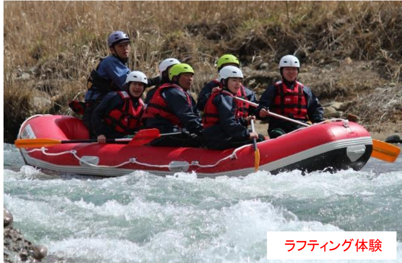
ラフティング体験